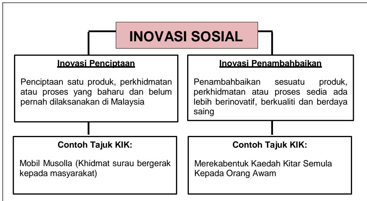
Rajah 1: Kategori bagi Bidang Inovasi Sosial dan Contoh Projek Yang Dihasilkan