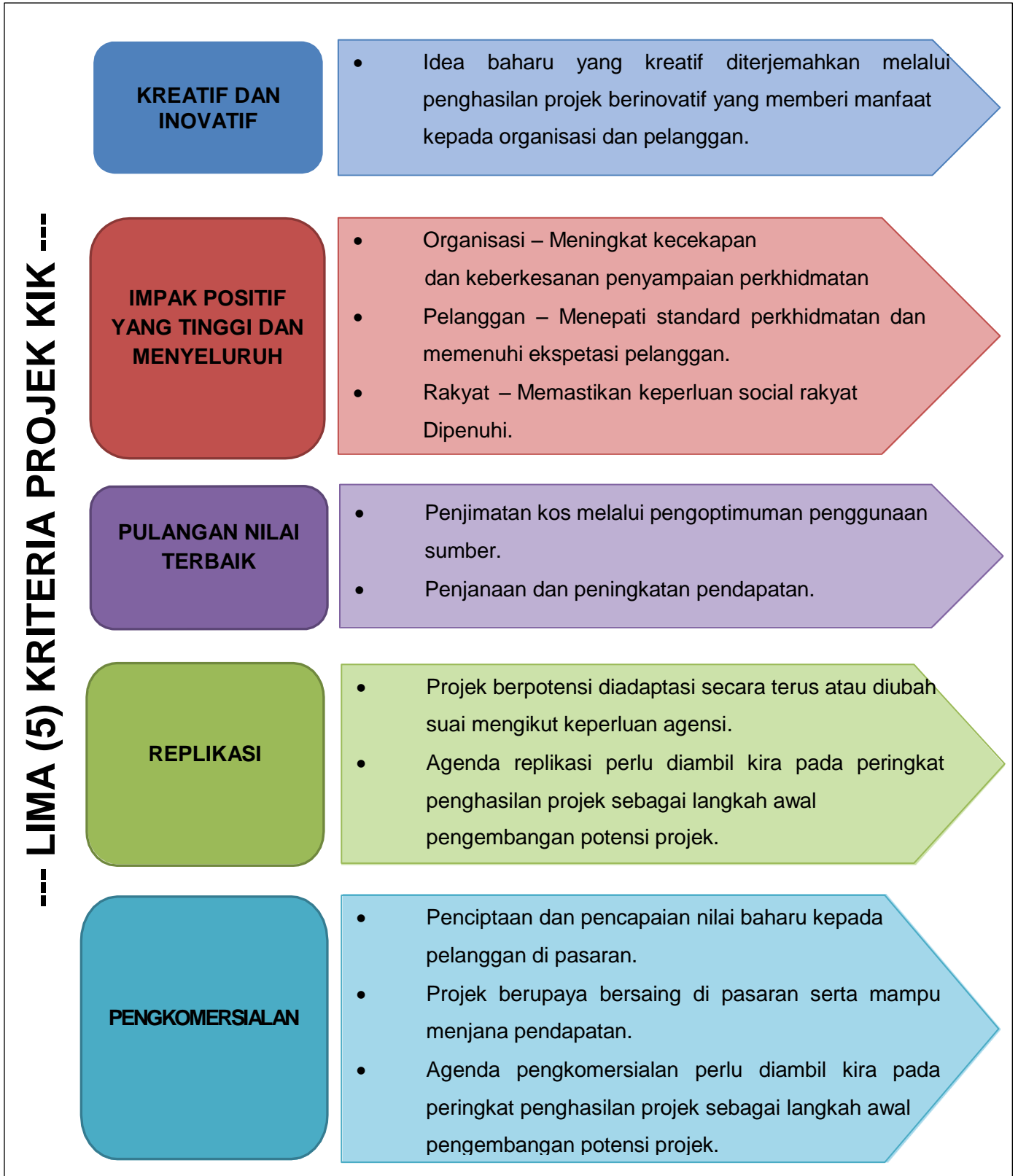
Rajah 4: Kriteria Penghasilan Projek yang Berpotensi untuk dikembangkan