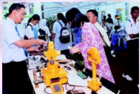
Peralatan kerja luar turut dipamerkan kepada pengunjung