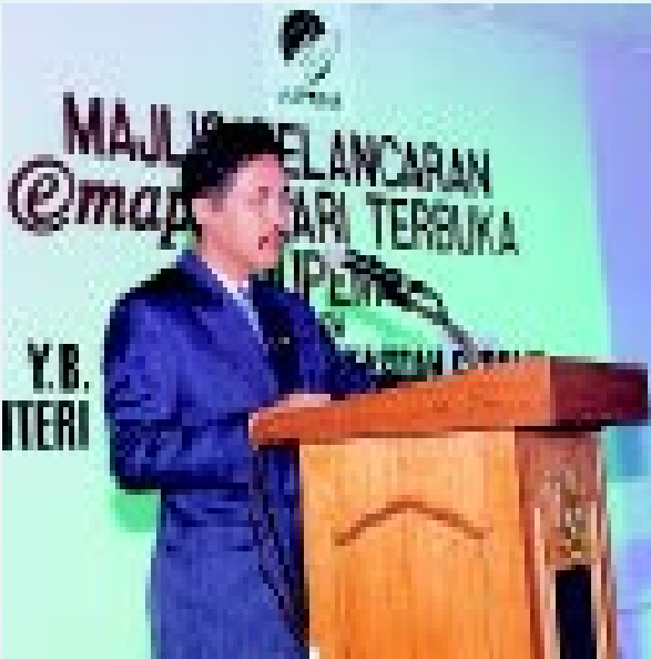
Ketua Pengarah Ukur dan Pemetaan ketika menyampaikan ucapan aluan di Majlis Pelancaran e-Map

objek 3D dilengkapi dengan alat exploration browsing tools yang mempunyai beberapa ciri khas termasuk pengukuran jarak, luas, bearing dan koordinat. Katanya, e-Map melalui paparan multi windowsnya membolehkan pengguna melihat peta dalam pelbagai skala termasuk menyediakan peta-peta lain seperti Peta Bandar yang lebih terperinci.