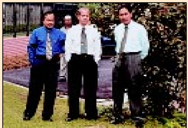
Ketua Pengarah Ukur dan Pemetaan bersama pegawai kanan lain turut menyaksikan kerja-kerja penyembelihan untuk ibadah korban