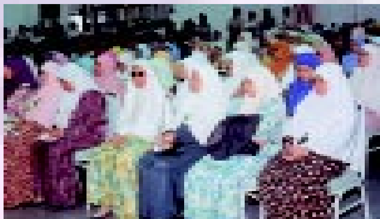
Sebahagian daripada tetamu yang hadir