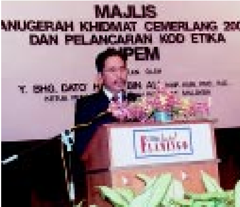
Ketua Pengarah Ukur dan Pemetaan ketika merasmikan Majlis Anugerah Khidmat Cemerlang JUPEM 2000

A NUGERAH Khidmat Cemerlang (AKC) yang diadakan adalah sebagai pengiktirafan dan penghargaan kepada barisan kakitangan JUPEM yang telah menampilkan kecemerlangan perkhidmatan dalam melaksanakan kerja dan tanggungjawab di tahun 2000. Penganugerahan ini diharap akan menjadi pendorong kepada barisan kakitangan JUPEM yang lain dalam menjalankan tanggungjawab dengan tekun, rajin dan efisien serta berterusan.