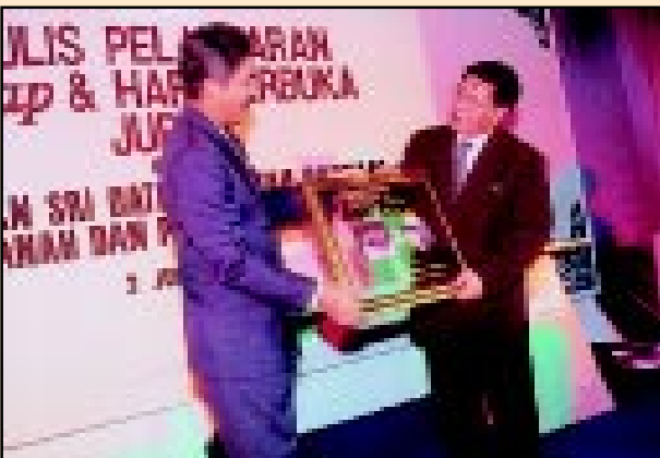
Ketua Pengarah Ukur dan Pemetaan menyampaikan cenderahati kepada YB Menteri Tanah dan Pembangunan Koperasi