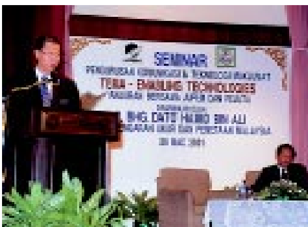
Timbalan Ketua Pengarah Ukur dan Pemetaan sedang berucap di Maljjs Perasmian Seminar

J ABATAN Ukur dan Pemetaan bersama Persekutuan Juruukur Tanah Bertauliah Semenanjung Malaysia (PEJUTA) telah menganjurkan seminar Pengurusan dan Teknologi Maklumat pada 28 - 29 Mac 2001 bertempat di Hotel Equatorial, Bangi, Selangor.