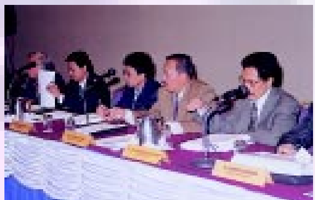
Sebahagian daripada Pengarah Ukur dan Ketua Seksyen yang hadir