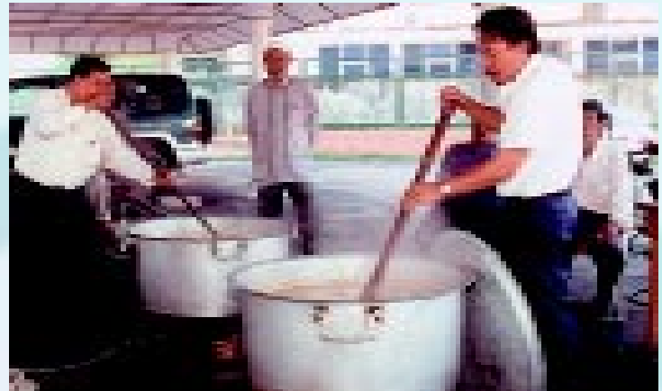
Kerja-kerja menyediakan Bubur Asyura dimulakan sejak awal pagi lagi oleh Jemaah Kakitangan Islam JUPEM Ibu Pejabat

B ULAN Muharam adalah bulan pertama dalam Tahun Hijrah. Sebagai meraikan kedatangannya, Sambutan Maal Hijrah telah diadakan pada 29 Mac 2001. Ceramah telah disampaikan oleh seorang penceramah bebas iaitu