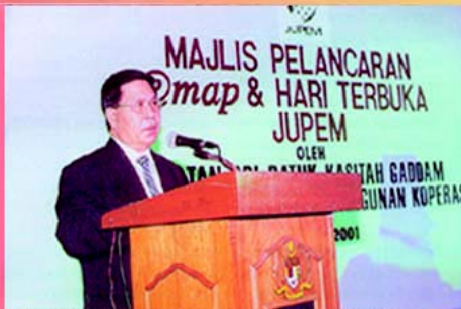
YB Menteri Tanah dan Pembangunan Koperasi ketika melancarkan e-Map dan Hari Terbuka JUPEM

J ABATAN Ukur dan Pemetaan Malaysia (JUPEM) telah mencatat sejarah sekali lagi apabila berjaya mengeluarkan produk terberunya iaitu Peta Elektronik atau e-Map. e-Map adalah sebuah produk terkini berkonsepkan interaktif multimedia hasil inovasi JUPEM yang menawarkan kepelbagaian dan kecanggihan kaedah pengeluaran peta yang lebih pantas, menarik dan efisien.