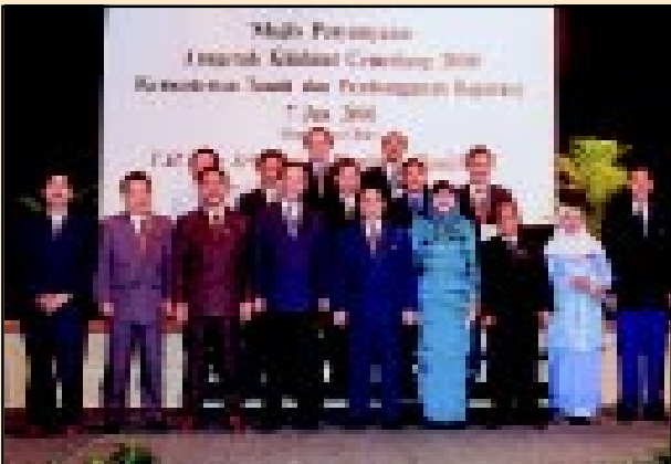
Pegawai Pengurusan dan Profesional JUPEM bergambar kenangan bersama YB Menteri di Majlis AKC yang diadakan pada 7 Julai 2001 di Hotel JW Marriot, Kuala Lumpur