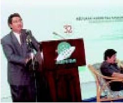
Pengarah Ukur Bahagian (Ukur Geodetik) ketika merasmikan mesyuarat

J ABATAN Ukur dan Pemetaan Malaysia (JUPEM) adalah diantara jabatan teknikal kerajaan terbesar dan tertua yang beroperasi di negara ini. Justeru itu, ramai di antara kakitangan JUPEM yang terlibat