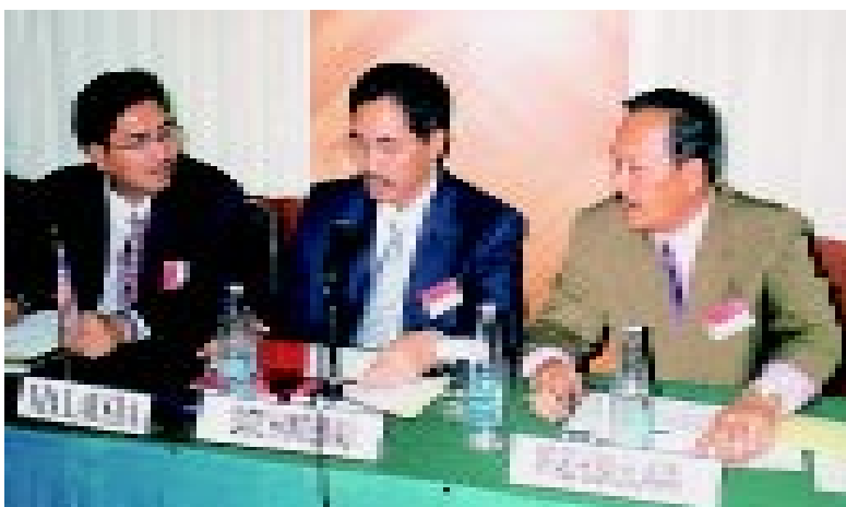
Ketua Pengarah Ukur dan Pemetaan berbincang bersama Pengarah Ukur Bahagian (Ukur Geodetik) dan Pengarah Ukur Topografi Sarawak

Mesyuarat ini juga bersetuju dengan perancangan untuk Musim Ukur 2002 yang melibatkan siasatan dan tanam pastian tanda sempadan A 1400 hingga B 001 di kawasan keutamaan I (A - B) dan dari tanda sempadan B 001 hinggian B 300 di kawasan keutamaan II (B - C) sepanjang 21.5 km dan 15.6 km. Manakala bagi sektor Sarawak - Kalimantan Barat dari tanda sempadan A 1 hinggian A 156 di kawasan keutamaan I (A - C) sepanjang 29.3 km.