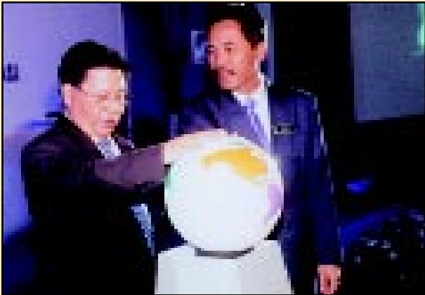
Ketua Pengarah Ukur dan Pemetaan mengiringi YB Menteri Tanah dan Pembangunan Koperasi dalam satu acara yang simbolik di Majlis Pelancaran e-Map