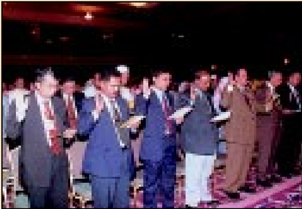
Lafaz ikrar Kod Etika oleh semua Pengarah Ukur Negeri dan Ketua Seksyen dilakukan selepas ianya dilancarkan