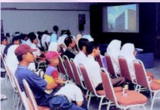
Para pelajar mendengar taklimat kerjaya di Dewan Ukur

Pada peringkat permulaan, e-Map yang dilancarkan ini mengandungi 6 buah peta iaitu Peta Malaysia pada skala 1:2,000,000; Peta Semenanjung, Sabah dan Sarawak (1: 750,000) serta Peta Bandar Kuala Lumpur dan Peta Putrajaya (1: 10,000). Penerbitan e-map bagi setiap negeri akan menyusul secara berperingkat-peringkat dan matlamat JUPEM adalah untuk menghasilkan e-map bagi seluruh negara. e-Map juga mempunyai informasi yang dapat dimanfaatkan oleh para pendidik untuk digunakan dalam kaedah pengajaran dan pembelajaran subjek geografi di sekolah-sekolah.