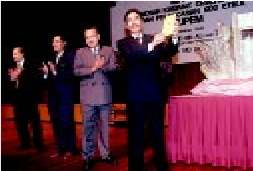
Ketua Pengarah Ukur dan Pemetaan menunjukkan Buku Kod Etika sejourus ianya dilancarkan