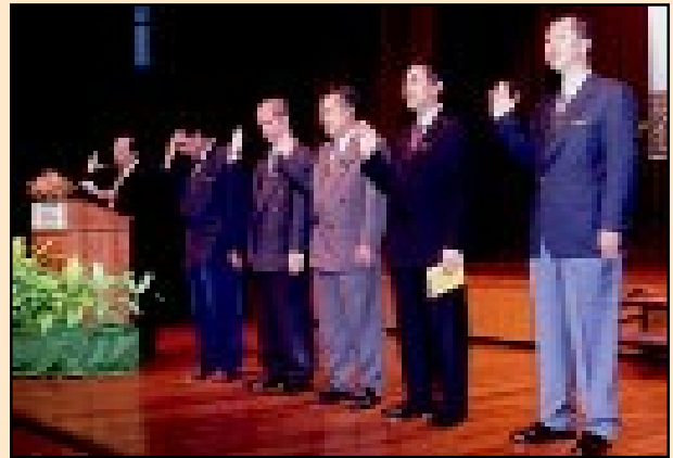
Pengarah Ukur Bahagian (Pengeluaran Pemetaan) mengetuai bacaan lafaz ikrar Kod Etika bersama Ketua Pengarah Ukur dan Pemetaan dan Pengurusan Tertinggi JUPEM