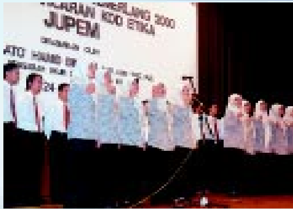
Persembahan koir JUPEM menyerikan Majlis Anugerah Khidmat Cemerlang