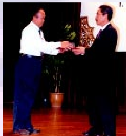
Ketua Pengarah Ukur dan Pemetaan menyampaikan sijil AKC