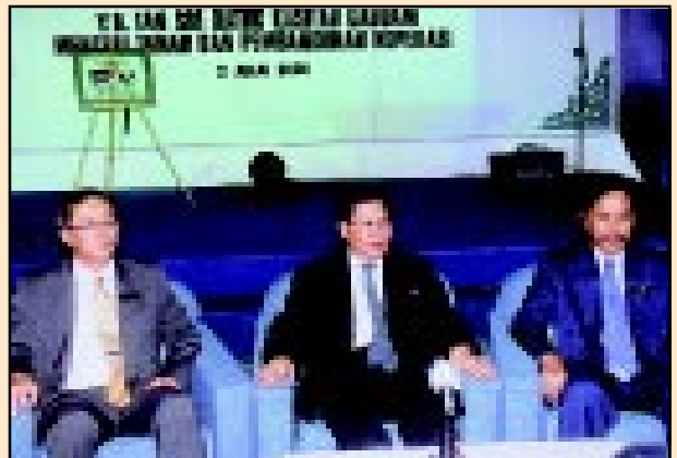
YB Menteri Tanah dan Pembangunan Koperasi mengadakan sidang akhbar selepas Majlis Pelancaran e-Map dan Hari Terbuka JUPEM