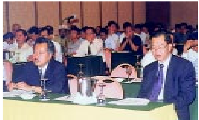
Sebahagian daripada peserta yang hadir