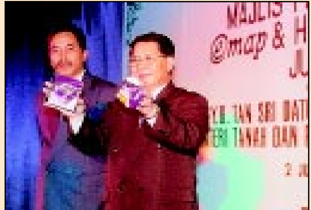
YB Menteri Tanah dan Pembangunan Koperasi menunjukkan CD e-Map sejourus Majlis Pelancaran kepada tetamu yang hadir