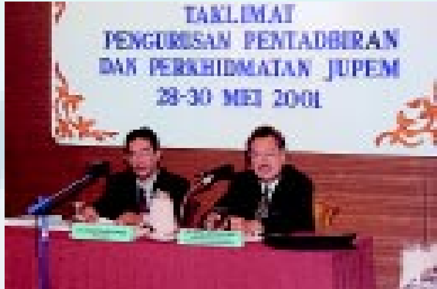
Pengarah Ukur Bahagian (Pengurusan dan Pembangunan) dalam sesi perbincangan bersama peserta

Walaupun bilangan kakitangan bukan teknikal di JUPEM adalah kecil berbanding dengan kakitangan teknikal, namun peranan dan sumbangannya sebagai khidmat sokongan adalah sangat penting dan memberi kesan kepada prestasi JUPEM. Justeru itu, JUPEM akan dapat membentuk pasukan kerja yang cekap dan efisien di setiap negeri dan seksyen-seksyen bagi menyelaraskan dan menyeragamkan bentuk pengurusan pentadbiran disamping mengeratkan hubungan sesama kakitangan pentadbiran di semua peringkat.