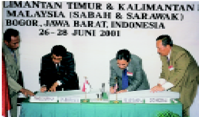
Ketua Pengarah Ukur dan Pemetaan sedang menandatangani Syit Field Plans bersama ketua perwakilan Indonesia

Walaupun pada dasarnya, kerja-kerja penandaan dan pengukuran sempadan Antarabangsa Malaysia - Indonesia bagi Sektor Sabah - Kalimantan Timur dan Sektor Sarawak - Kalimantan Barat telah siap, namun kerja-kerja penyelenggaraan dan sissatan serta manaik taraf akan terus dijalankan. Ia akan dilaksanakan mengikut keutamaan kawasan.