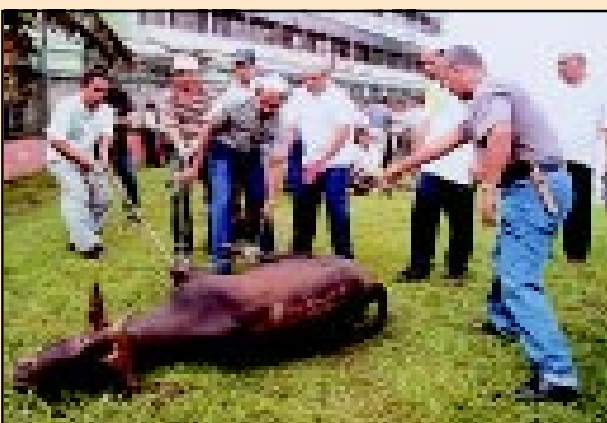
Kakitangan JUPEM berkerjasama menjalankan kerja-kerja khusus sebelum penyembelihan ibadah korban dilaksanakan