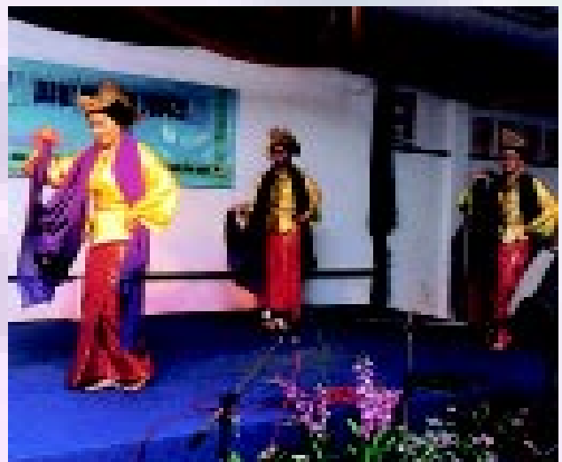
Persembahan kesenian dari kalangan ahli-ahli