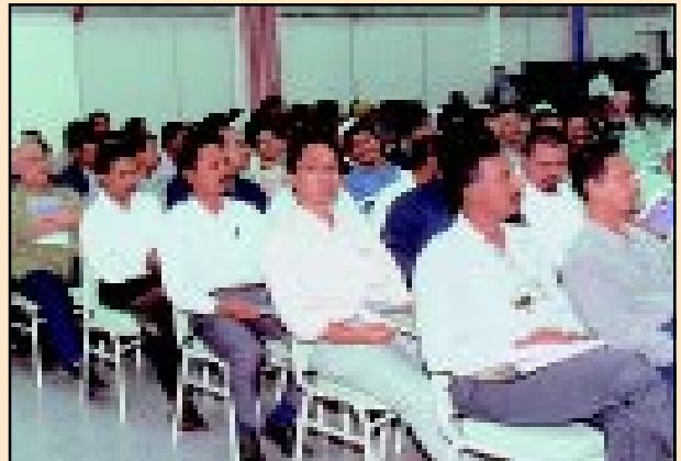
Sebahagian kekitangan dari pelbagai jabatan yang menghadiri Mesyuarat Agung Ke 32 MTSU W.P Kuala Lumpur di JUPEM