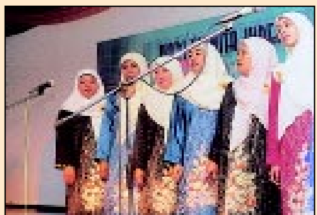
Ahli-ahli PUSPANITA JUPEM juga berbakat dalam membuat persembahan koir