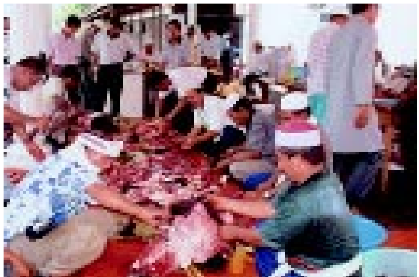
Kakitangan JUPEM sedang menguruskan daging korban untuk agihan