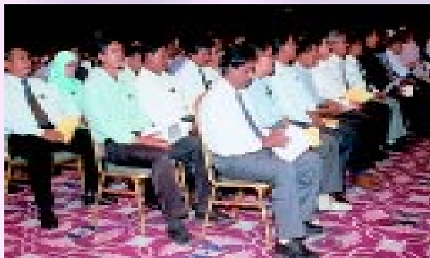
Sebahagian daripada penerima Sijil AKC 2000