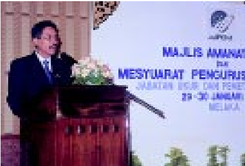
Ketua Pengarah Ukur dan Pemetaan sedang menyampaikan amanat dan ucapan dasar untuk tahun 2001

U NTUK mencapai kejayaan yang lebih cemerlang bagi sesebuah organisasi, peranan pihak pengurusan dalam menyampaikan matlamat dan dasar adalah penting bagi melicinkan pelaksanaan program tahunan yang dirancang. Dalam hubungan ini, pada 29 Januari 2001, JUPEM telah mengadakan Majlis Amanat Ketua Pengarah di Melaka.