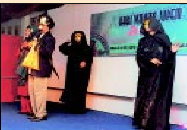
Aksi ahli-ahli PUSPANITA JUPEM dalam salah satu persembahan yang dipertontonkan