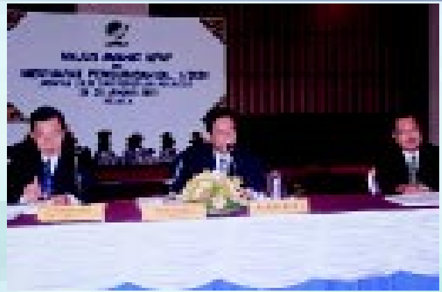
Ketua Pengarah Ukur dan Pemetaan sedang mempengerusikan Mesyuarat Pengurusan JUPEM

Sebagai langkah dalam mewujudkan perkhidmatan yang mantap dan mampu menyahut pelbagai cabaran serta dapat memberikan sumbangan yang berkesan kepada pelaksanaan