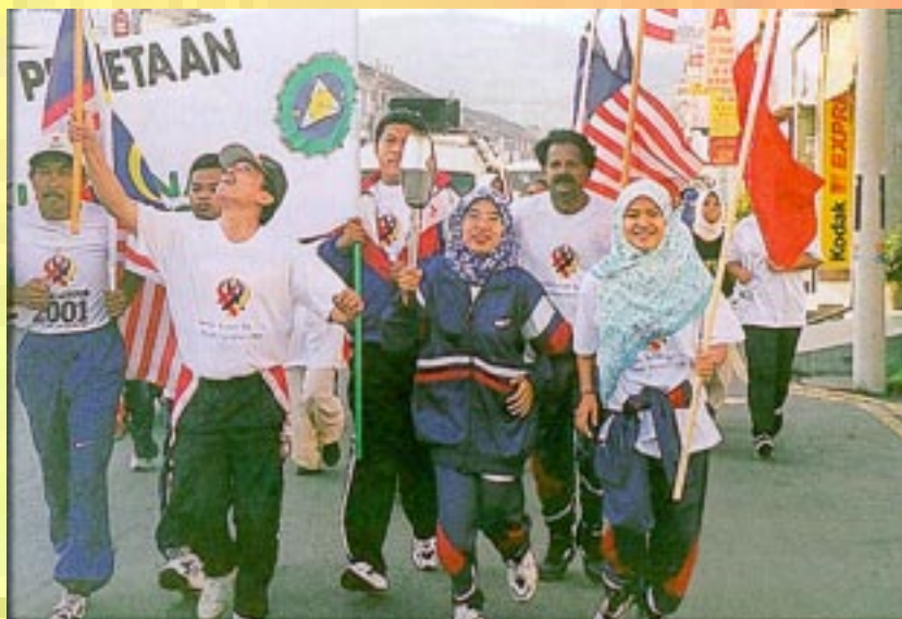
Kakitangan JUPEM Kedah bertukar ganti membawa obor semasa larian

Larian Obor ini yang dibawa menjelajahi seluruh pelusuk negara dalam usaha mempromosi sukan dwi tahunan itu kepada semua lapisan masyarakat merupakan sebahagian daripada komitmen JUPEM dalam menjayakan Kuala Lumpur 2001, Sukan SEA XXI.