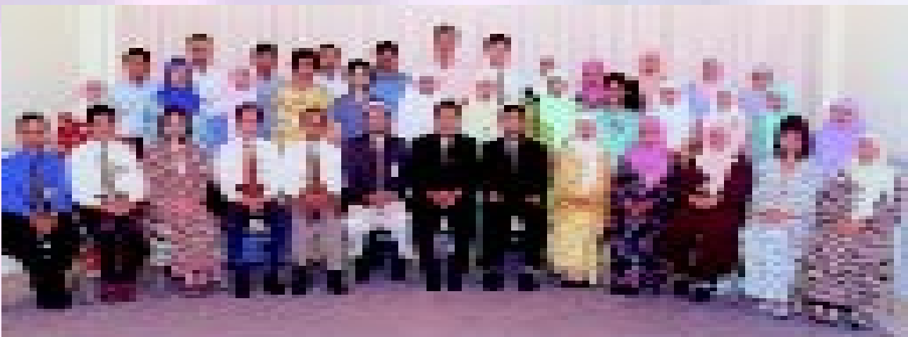
Peserta bergambar kenangan bersama Pengarah Ukur Bahagian (Pengurusan dan Pembangunan)