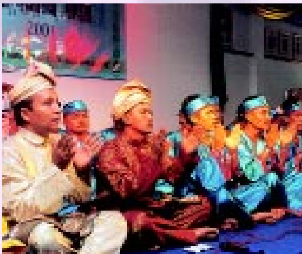
Persembahan dikir barat oleh kakitangan Jabatan Penjara Sungai Buluh

tetamu dihiburkan dengan persembahan nyanyian, tarian dan deklamasi sajak dari kalangan ahli-ahli. Turut memeriahkan majlis adalah persembahan Kumpulan Dikir Barat yang didatangkan khas dari Jabatan Penjara Sungai Buluh. Selain dihiburkan dengan persembahan kesenian dan kebudayaan, penganjur juga mengadakan cabutan nombor bertuah kepada tetamu yang menyediakan hadiah-hadiah menarik dan istimewa.