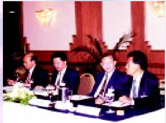
Sebahagian daripada perwakilan Malaysia yang hadir dalam mesyuarat persempadanan